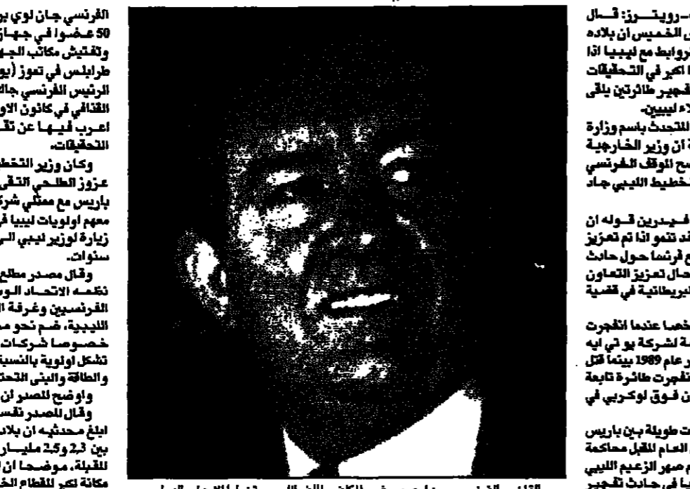
الفرنسي جان لوي بروجييه وزير الخارجية التقى امس في باريس مع وزير العدل الليبي عبد الحميد الخليلي.

باريس - اب رويترز: قال وزير العدل الليبي عبد الحميد الخليلي امس في باريس مع وزير الخارجية الفرنسي جان لوي بروجييه ان ليبيا مستعدة لتعاونها مع فرنسا في تحقيقات قضائية دولية. وقال الخليلي ان ليبيا مستعدة لتعاونها مع فرنسا في تحقيقات قضائية دولية.